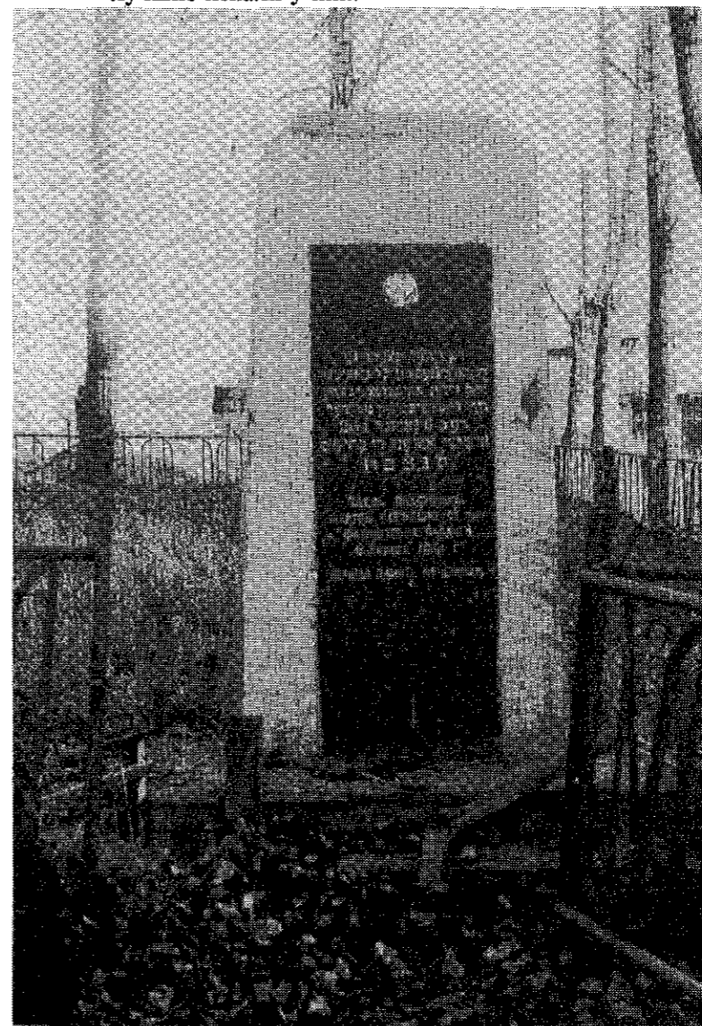
Тот же памятник на могиле евреев в Климовичах, что и на предыдущей фотографии, через 25 лет. Белое пятно в верхней части памятника — след от маген-давида, сбитого по распоряжению местных властей в 1967 году, после Шестидневной войны. Местным евреям было объяснено, что следует убрать этот "фашистский знак". (Климовичи, 1988 г.)

— Гараж, куда всех евреев загнали, находился за больницей перед мостиком по дороге в Павловичи. Там, в гараже, полицаи с немцами их ощупывали, вещи лучшие искали у них.