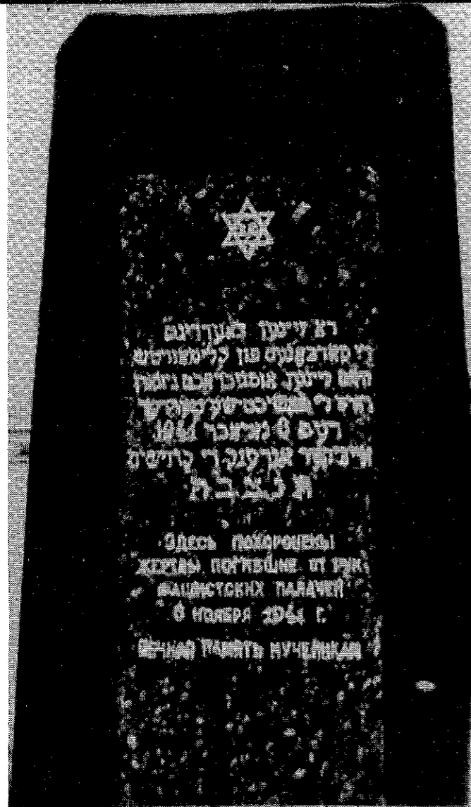
В конце 50-х годов на братской могиле 900 евреев на окраине Климовичей, за больницей (ныне ул. Березовая), родственниками погибших был установлен скромный памятник с маген-давидом и надписями на идиш и по-русски. (Климовичи, 1963 г.)

приношенное, валенки с калошами, платок — это уже осень была. На всякий случай попрощались, конечно. Они считали, что меня уже не будет в живых.