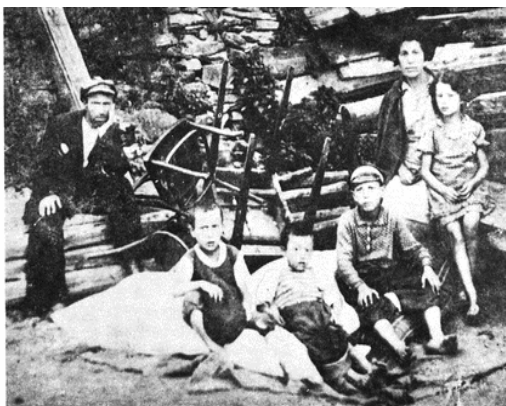
קרבנות האורבניזציה בשנת 1936 — חשפחת אייכירס נושגה חזירחם.

היהודים בלודביפול סבלו כל חייהם מפגעי ממשלים מייסרים ומדכאים: פטליוורה, חמלניצקי, היידמקים, קוזקים, קרנסקי, מהפכה רוסית, פולנים ושוב רוסים, עד אשר קיבל הממשל הפולני את השלטון ולודביפול נשארה פולנית. עם כל שלטון חדש הפכו דם ורכוש יהודי הפקר. כל ממשל חדש הטיל אימה על העיירה היהודית. הורינו זוכרים היטב את מלחמת העולם הראשונה, רעב ושרפות היו מחותנים ראשיים בעיירה. כשהחלו החיים ב-1920 לזרום כסדרם, נשתכחו מעט הצרות הישנות ואנשי לודביפול שבו לבנות וליצור מחדש.