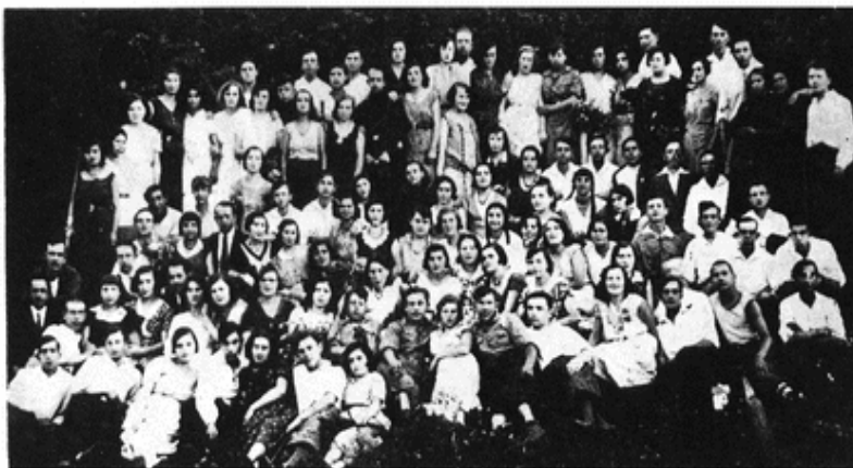
אסיפה כוללת של "החלוץ" בשנת 1929 על יד מבצר חופקוב

מנשיקוב. בשבת אחר הצהריים נערכו אספות של קני החלוק, בית"ר, ומילות "התקווה" נישאו למרחקים. במישור, שבו היו שדות להרשיק ולגדליה של בְּנֵיה, קטפו ילדים ענפים לשבועות לקשט בהם את בתיהם, את בתי הכנסת, את בית הספר. ובחורף, במקום שקפאו בו המים – החליקו. הנוער לא נאלץ לחפש מקום בילוי, אך יצאו מן הבית גגשו את החבֵרָה מטיילים ברחובות, משוחחים ומעבירים ביקורת עד חצות.