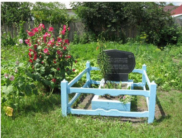
המצבה שהוקמה בחצר לאחר העברת העצמות לקבורה באתר