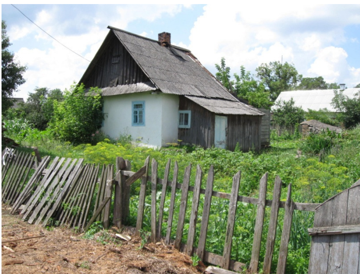
כאן בחצר היה קבר אחים שעצמותיהם הועברו ב-1997 לאתר הנצחה