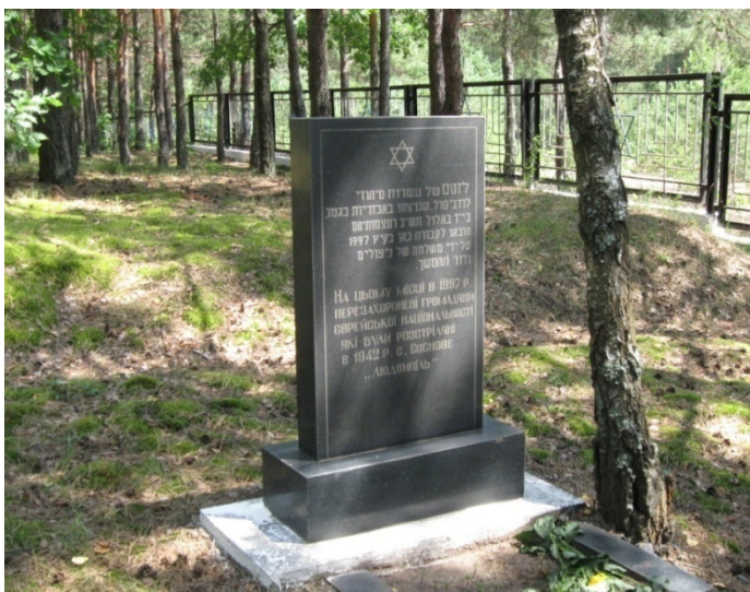
המצבה מ-1997 שהוקמה באתר לאחר העברת עצמות נרצחים