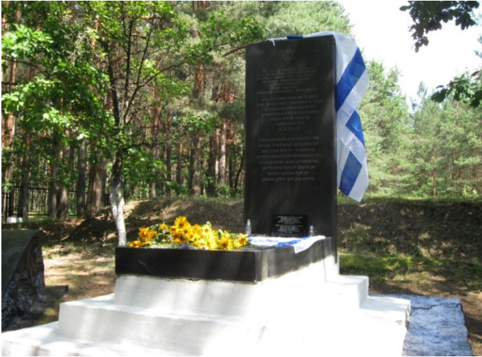
המצבה לפני קבר האחים