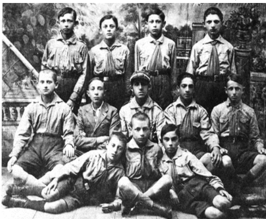
קבוצת השומר הצעיר והמורה פרימק, 1925

מה חסר בעיירתנו הקטנה לודביפול? הכול היה לי: אבא, אימא, בית טוב, אחיות, אחים, חינוך טוב בבית הספר "תרבות", חברים טובים, אחווה בין היהודים בעיירה; כשחזר מישהו מחו"ל היה אומר שעיירה כזו אין ולא תהיה.