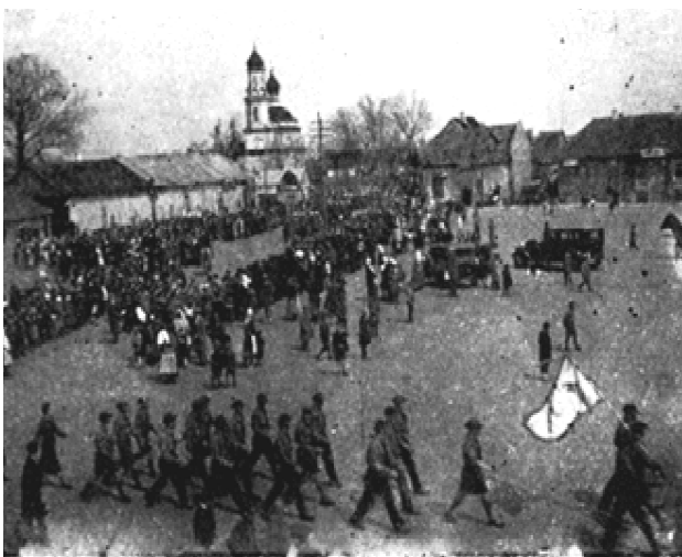
"השומר הצעיר" צועד ברחובות קמין קושירסקי בל"ג בעומר 1939

דיברנו ארוכות על רגע זה ולא יכולנו לשכוח. אך על כל צעד ושעל חשנו בהולם הלב הציוני.