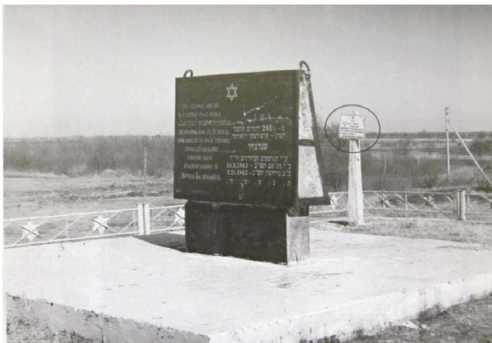
קבר האחים והמצבה בבית העלמין בעיירה. מאחור: ציון קבורת עצמות נרצחי גלושה זוטא, הועברו ע"י אברהם ביבר [ביבר]