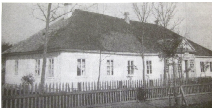
משרדי המועצה המקומית – הגמינה, 1932 [ביבר]