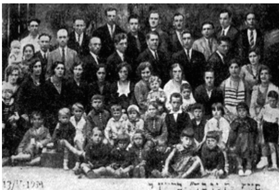
סניף "העובד" בקמין קושינסקי בשנת 1934