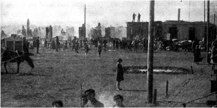
פסע מהשוק. בין הבנינים: בית המדרש והסטריסקר שטיבל

פרנסת העיירה הייתה בעיקר על מסחר ומלאכה למען האיכרים שהיו באים לירידים. כשהאיר היום זרמו הגויים לעיירה מכל עבר. מכל כפרי הסביבה היו באים עם סוסים ועגלות שאליהן נקשרה תכופות פרה, ובתוך העגלות היה מכל טוב התוצרת הכפרית. הם היו מציבים את יצולי העגלות וסועדים את לבם. כשמכר האיכר את הפרה, והאישה את האוכמניות היבשות, הביצים, הפטריות ושער החזיר שלה, פנו לחנויות לקנות מיני סחורות, בחורף קנו אדרות שער ומגפיים. לאחר מכן הלכו לפונדק ללגום משהו.