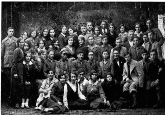
"החלוץ" בקמין קושירסקי

החבר לייבוש לב היה פעיל מאוד בעבודה התרבותית בחלוץ. כל צעיר שהצטרף ידע כי על מנת שיוכל לנסוע לארץ ישראל עליו להיות מסוגל לעבוד, והכשיר את עצמו.