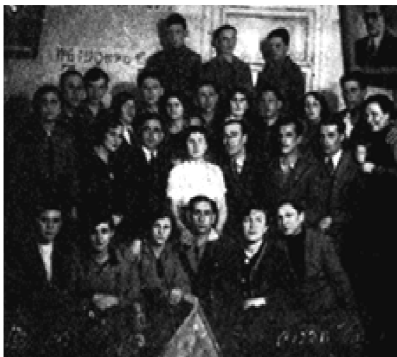
"פועלי ציון" צ' ס' בקמין קושירסקי