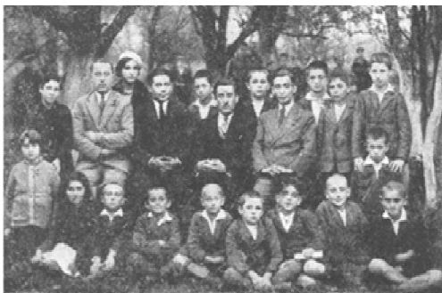
כיתה ג' בבית ספר "התחייה"

וכך, לאחר מאמצים רבים ויגיעה, נפתח כעבור שנה בית הספר "התחייה", בבית מאיר רויזן. המורים היו בוגרי סמינר למורים של "תרבות", ציונים טובים שחינכו את הילדים ברוח לאומית.