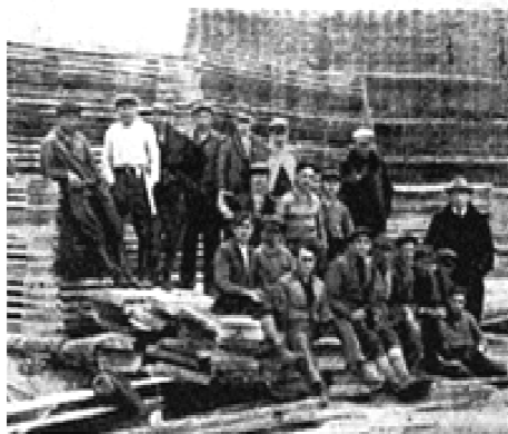
קיבוץ קלוסובה בקמין קושירסקי

לאחר מכן בא בעל-הבית של העיר, הסטרוסטה, שהכיר את אימא, ושכר את הדירה לשנתיים. סידרו מועדון לפקידי ממשל, ומסעדה. הם קיימו גם אספות אנטישמיות במקום, ואימא ציפתה ליום בו יסתיים החוזה. בתום השנתיים הבהירה אימא שאינה משכירה עוד, היא נזקקת לדירה לעצמה. המועדון פינה את המקום. לאימא היה לב ציוני חלוצי, אחד מילדיה היה בקיבוץ וקשר את עתידו בארץ ישראל. היא הבחינה כי הקיבוץ בעיירה שלנו מתגורר בתנאים קשים וסובל, והחליטה להשכיר את הדירה לקיבוץ.