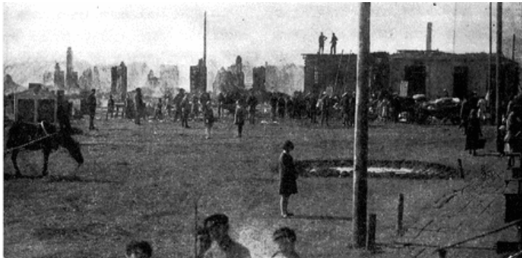
קסטע מהשוק, בין הבנינים: בית המדרש וה"סריסקר שטיבל"