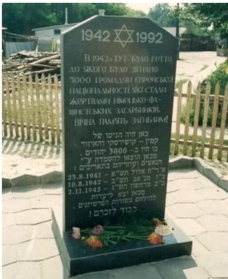
מצבה בכניסה לגטו. מכאן הובלו היהודים לגיא ההרגה בבית העלמין [אתר]