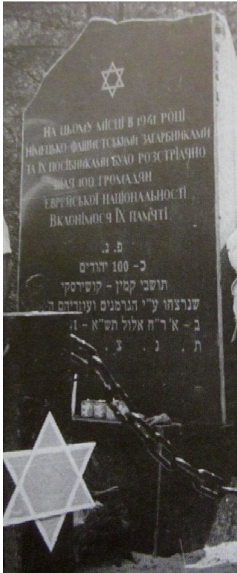
מצבה במקום בו נרצחו מאה יהודים, במרחק כ-5 ק"מ מקמין [ביבר]