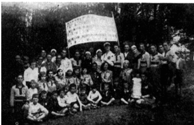
חגיגות ל"ג בעומר של ארגון "פרייהייט" לטובת קק"ל

וציוני כללי עם חבר "השומר הצעיר". כל מפלגה ציונית שלחה את חבריה הבולטים והטובים ביותר לקק"ל, ומדי שנה נבחרו: מורשה (יושב ראש), מזכיר, גזבר, ועדת ביקורת וגם חברים שיהיו אחראים לאמצעים מיוחדים כמו הקופסאות וכך הלאה. לא היה בעיירה שלנו בית שלא הייתה בו הקופסה הכחולה-לבנה, שלתוכה השליכה כל אישה יהודיה בערבי שבתות וחגים, לפני ברכת הנרות ובהזדמנויות אחרות, מטבע בעונג. בסוף כל חודש עברו חברינו ורוקנו את הקופסאות. הונהג שכל אחד משלם סכום מסוים, ואם לא היה בקופסה הסכום, הוסיפו מתוך הארנק.