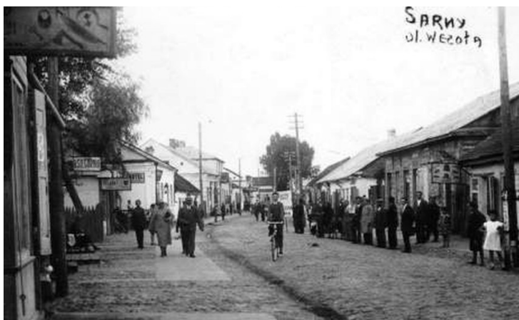
רחוב ויסולה

מתוך הפרק: אורחות חיים, תנועות ומפלגות ע' 211 – 212