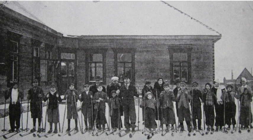
בניין בית הספר "תרבות"