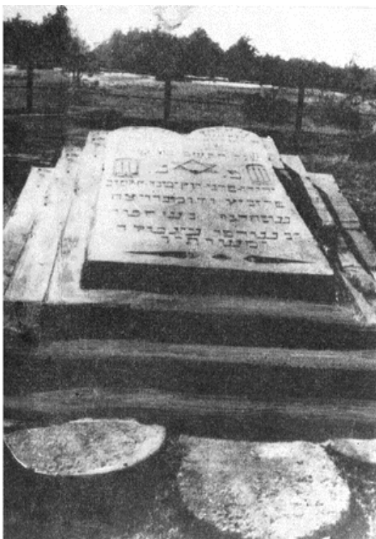
קבר אחים ומצבה

מתוך הפרק: לזכר נעדרים ע' 494 – 495; 501 – 502