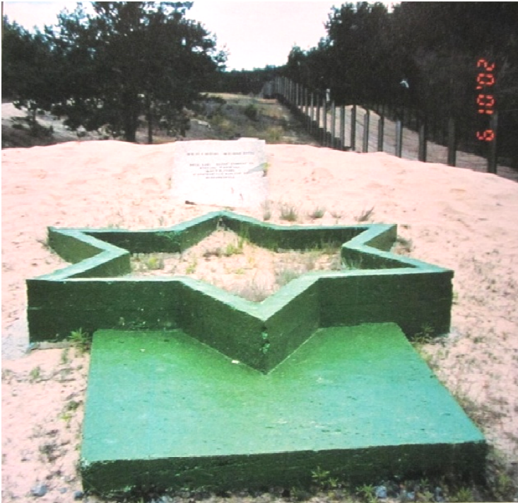
קבר אחים וקטע מצבה מן התקופה הסובייטית