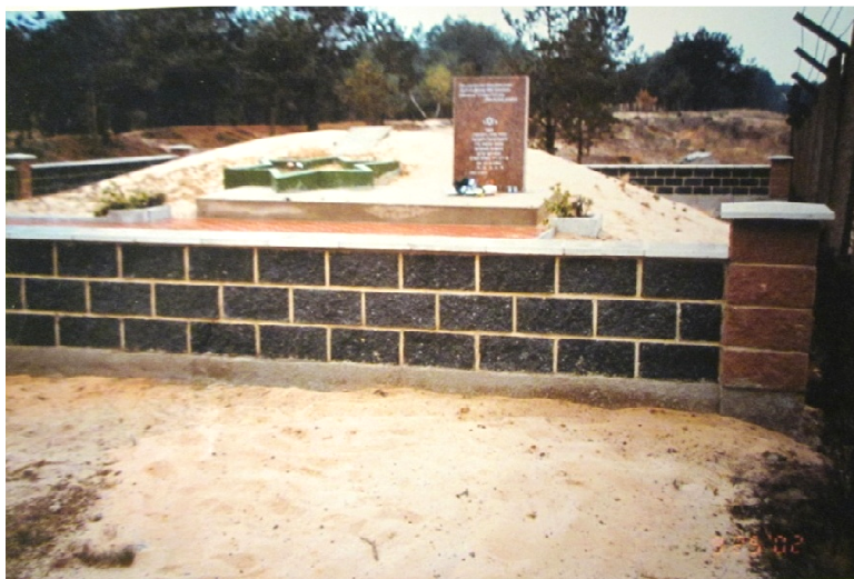
קבר אחים, מצבה חדשה לצד קטע מצבה מן התקופה הסובייטית