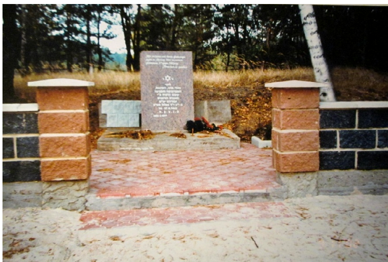
קבר אחים ומצבה חדשה