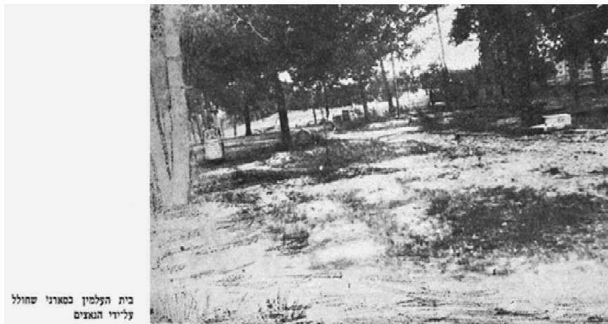
בית העלמין בסארני שחולל עליידי הנאצים

מתוך הפרק: איכה חרבה, במלחמה על הצלה ועל חיים ע' 368 – 369