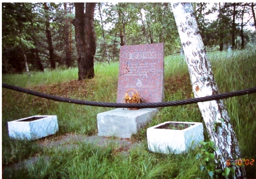
מצבה מן התקופה הסובייטית