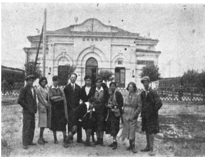
תחנת הרכבת מצד צפון

מתוך הפרק: אורחות חיים, בחול ובמועד ע' 235 – 236