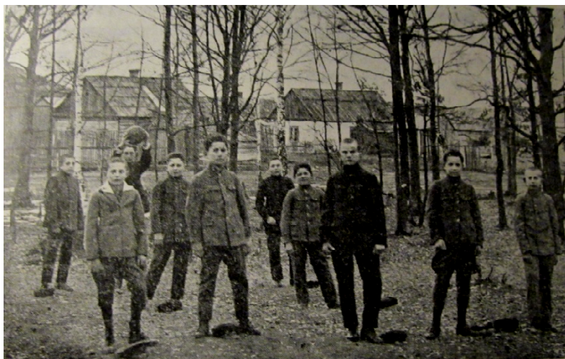
בני נוער מאחורי בית הכנסת. ברקע ההקדש